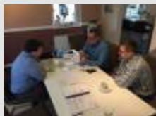
beim Planungs- gespräch