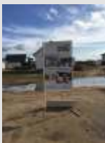
bald geht es los

schneller als gedacht - das Fundament wird vorbereitet